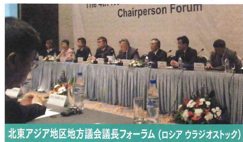
北東アジア地区地方議会議長フォーラム(ロシアウラジオストック)