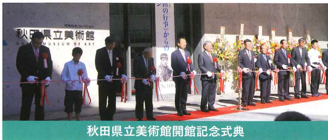
秋田県立美術館開館記念式典

鳥海山とそれに連なる圏域の 発展こそ私の願い。 県議会議員六期二十三年目を 日々全力で活動し続けています。