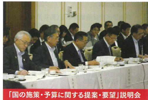
「国の施策・予算に関する提案・要望」説明会

お陰さまで、昨年5月から秋田県議会第68代副議長として、東奔西走する 充実した日々 を過ごしております。