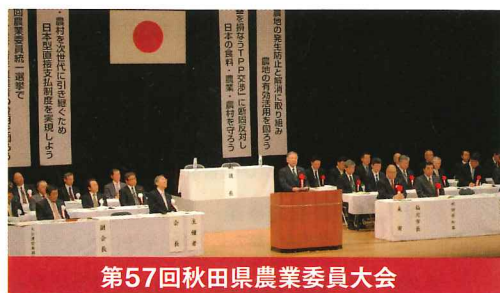
第57回秋田県農業委員大会