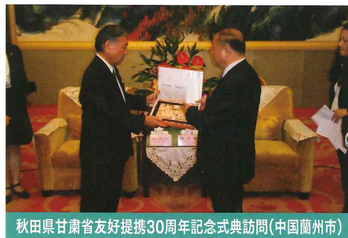
秋田県甘肅省友好提携30周年記念式典訪問(中国蘭州市)