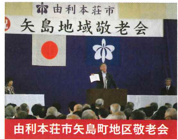
由利本荘市矢島町地区敬老会